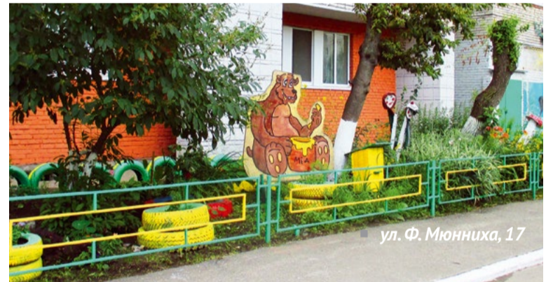
ул. Ф. Мюнниха, 17

Итоги конкурса были торжественно подведены в конце сентября. Двор по ул. Мюнниха, 13 не вошёл в тройку лидеров. Однако, по мнению собственников, это не главное. Ведь важны не победы (которые, уверены люди, ещё впереди), а участие в общем большом деле развития родного города. *