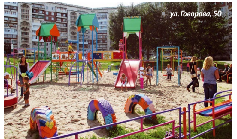
ул. Говорова, 50